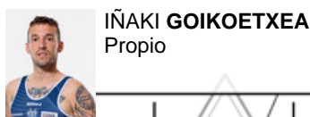
IÑAKI GOIKOETXEA Propio