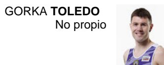
GORKA TOLEDO No propio