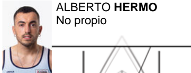
ALBERTO HERMO No propio