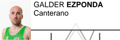
GALDER EZPONDA Canterano