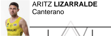
ARITZ LIZARRALDE Canterano